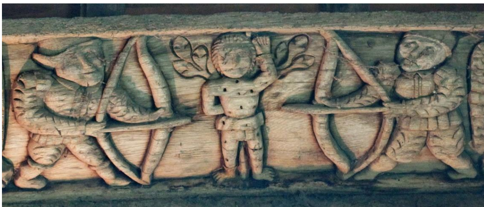
Sablière du transept de la chapelle Saint Sébastien du Faouët 1598

La plupart des Compagnies d'Arc se regroupent sous la bannière de Saint Sébastien mais quelques-unes ont conservé leur attachement à Saint Georges.