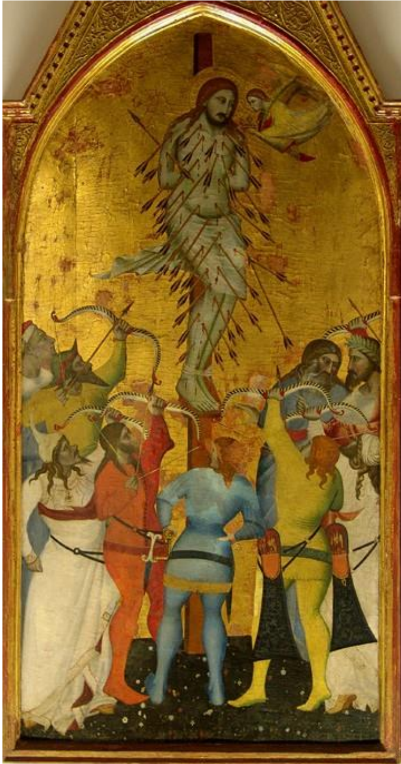
Le martyre de Saint Sébastien Giovanni Del Biondo (vers 1380)