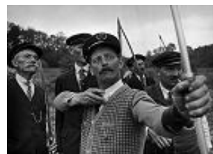
Réf. HCB1936003W00001

A cette occasion Henri CARTIER-BRESSON prend des clichés dont trois concernent directement l'archerie.