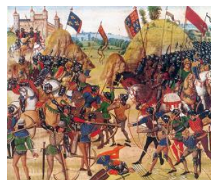
Bataille de Crécy Chronique de Jean Froissart FR 2643, fol. 165v