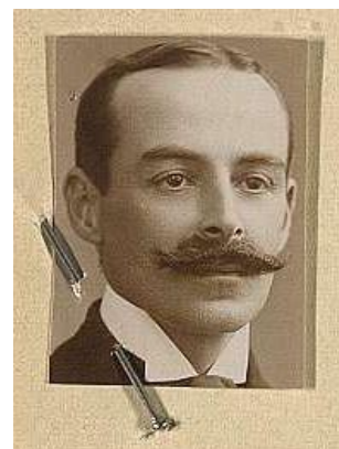
Comte Léon Bénigne Albert de Bertier de Sauvigny

La Fédération des compagnies d'arc de l'Île-de-France, créée en 1899, devenue Fédération des compagnies d'arc de France