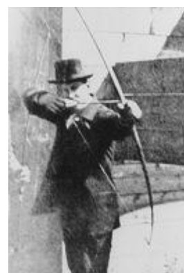
Archery competitor at the 1900 Olympic Games in Paris