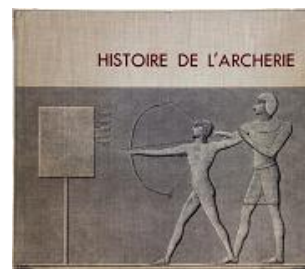
Histoire de l'Archerie Robert Roth