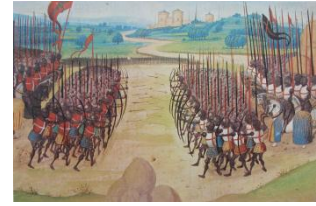
Bataille d'Azincourt Chronique d'Enguerrand de Monstrelet xv e siècle

Publication, par Michel Lenoir, du premier livre imprimé connu portant sur l'archerie, Lart d'archerie , dont l'auteur est anonyme et dont il ne reste que six feuillets conservés à la biblio-