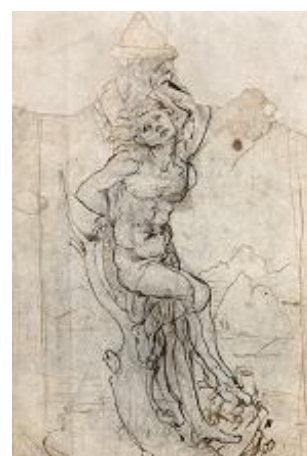
Saint Sébastien Léonard de Vinci (1452-1519)